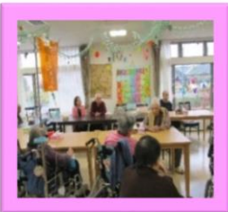
前回のお食事です。