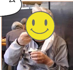
ソフトクリーム 最高!!