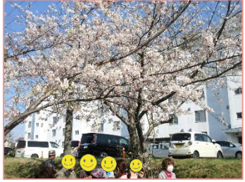
▲もみじ台 桜のトンネルを散歩